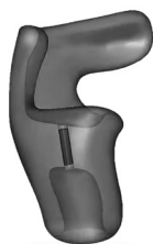
BAUFORM CIC MIT ABSTÜTZUNG